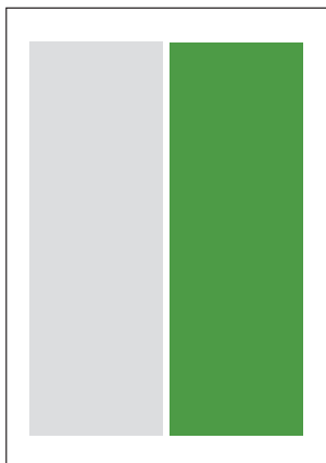
1/2 im Satzspiegel 85 x 238 mm